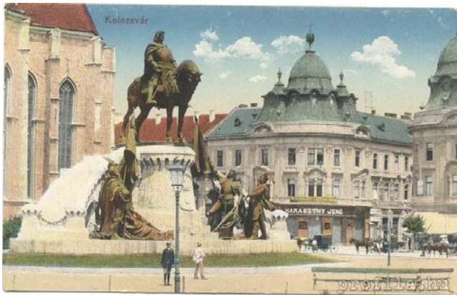
Kolozsvár főtere, Mátyás-szobor

a Perspektíva Jövőért Alapítvány vezetősége